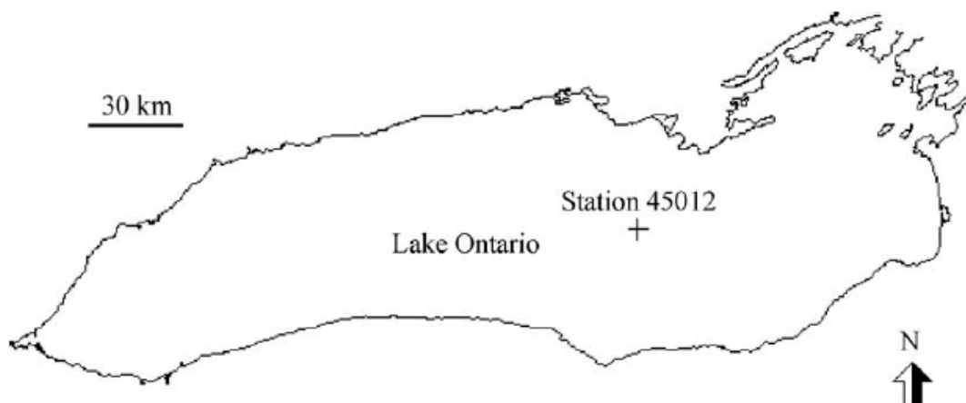
شکل ۲: دریاچه آنتاریو و موقعیت ایستگاه ۴۵۰۱۲