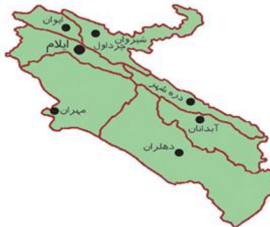
شکل ۱- تقسیمات استان ایلام

در این تحقیق جهت مقایسه اقتصادی هزینه اجرا و بهره‌برداری سیستم‌های مختلف شبکه جمع‌آوری فاضلاب از سه روستای واقع در استان ایلام به عنوان موارد مطالعاتی استفاده شده است. موارد مطالعاتی شامل روستاهای زنجیره علیا و سرتنگ زنگوان از توابع شهرستان شیروان چرداول و روستای سراب ایوان از توابع شهرستان ایوان می‌باشند. شکل شماره ۱ نشان‌دهنده موقعیت شهرستان‌های شیروان چرداول و ایوان می‌باشد.