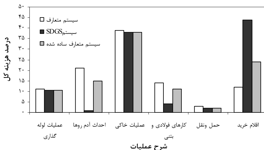
شکل ۳- مقایسه نسبت هزینه اجرایی بخش‌های مختلف سیستم‌های جمع‌آوری فاضلاب به هزینه کل شبکه در روستاهای مورد مطالعه